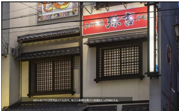
のれんをくぐれば活気あふれる店内。地元の新鮮な魚介と地酒をたっぷり味わえる。